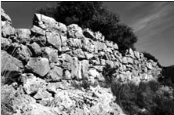
Fig. 4: Fondi, loc. «Pianara»: tratto di mura; v. tav. XII a p. 292

Da questo punto di vista, un confronto con il modello insediativo prevalente nel Lazio meridionale e nella Campania (ma non solo) per l'epoca preromana suggerisce di cercare una risposta non in pianura, ma piuttosto sulle alture del circondario, in posizione naturalmente difesa 31 . Ed è proprio da uno dei rilievi che circondano la piana di Fondi che viene un'importante novità, di cui si è data notizia più dettagliata altrove 32 e di cui riassumiamo qui i dati essenziali. Si tratta della collina di 'Pianara', a ca. 2,5 km ad est di Fondi. Ad un'altezza di ca. 300 m s.l.m. si estende un'altura, composta da tre pianori distinti: sul maggiore si conservano tratti di una cinta muraria in opera poligonale piuttosto rozza, che in alcuni punti tocca i due metri e mezzo di altezza (figg. 4-5). La pertinenza di queste strutture ad un abitato sembra suffragata dal tipo di reperti mobili che l'altura restituisce: durante le ricognizioni si è infatti avuto modo di registrare la presenza di numerosi frammenti di materiale laterizio, le cui caratteristiche suggeriscono una maggiore antichità rispetto a quelli di età repubblicana e imperiale restituiti dalla piana di Fondi, nonché di materiale ceramico ascrivibile al medesimo ambito cronologico 33 .