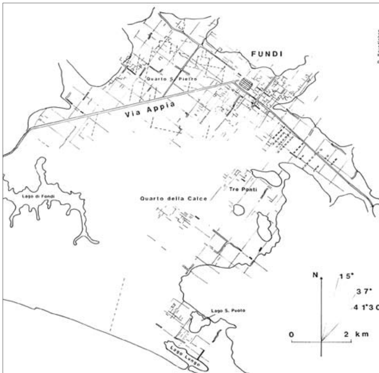
Fig. 6: Fondi: ipotetici tratti di divisione agraria (da CHOUQUER et al. 1987)

peraltro, è stata in passato spesso viziata da un'ottica romanocentrica: siamo molto poco informati su quelli che dovettero essere gli scontri tra Campani e Sanniti, oppure, per il territorio che ci interessa, tra Aurunci e Volsci. Ad ogni modo, il Lazio meridionale è intorno alla metà del IV secolo oggetto di mire espansionistiche sia da parte romana che da parte dei Sanniti 49 ; a riprova del fatto che in questo interesse il versante costiero non fosse escluso possiamo ricordare sia la circostanza per cui Fondani e Formiani vennero invitati alla ribellione contro Roma proprio dai Sanniti nel 328 (Liv. 8, 23), sia una serie di eventi bellici che hanno come teatro i dintorni di Terracina, tra cui spicca lo scontro nel 315 a Lautulae (Liv. 9, 23, 4) 50 . Dunque l'ipotesi di considerare le strutture difensive di Pianara come una conseguenza dei ten-