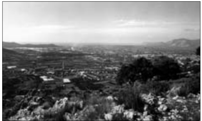
Fig. 5: Fondi: veduta della piana dal sito in loc. «Pianara»; v. tav. XII a p. 292

Per comprendere meglio il ruolo di queste strutture, è importante sottolineare la posizione del pianoro: l'altura domina infatti due vallate che con tutta probabilità in antico erano attraversate da tracciati stradali. Sul versante nord-est, è possibile riconoscere con una certa agevolezza un asse che dalla piana di Fondi conduceva verso Fregellae e dunque verso la via Latina. Verso sud-est invece, in direzione di Itri, passa l'Appia, con un andamento pedemontano che non si può escludere avesse recuperato un tracciato precedente (forse quello seguito dalle legioni romane nei loro spostamenti verso la Campania). Il confronto con i modelli insediativi per vici o pagi 34 , che caratterizzano le aree più vicine al territorio di nostro interesse, fa pensare che il sito di Pianara ospitasse almeno un nucleo della Fondi preromana, collocato in una posizione di notevole rilievo strategico, anche se ovviamente non va esclusa una pur precaria presenza in pianura, caratterizzata da «dispersed hamlets and farmsteads based on a subsistence agriculture» 35 . In un momento di incipiente romanizzazione il sito sarebbe stato gradualmente abbandonato per una posizione più vicina alle strade di comunicazione, dunque più favorevole anche dal punto di vista commerciale. Il nuovo insediamento, realizzato in allineamento con la via Appia, avrà costituito