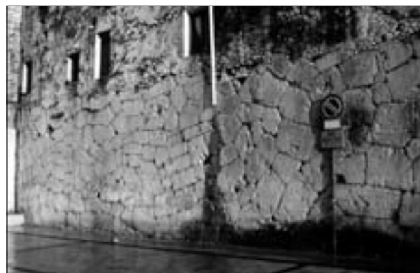
Fig. 2: Fondi: tratto di mura lungo viale Marconi

preferibile evitare conclusioni perentorie. È stato più volte sottolineato – fino a diventare ‘dogma’ – che la presenza di votivi anatomici fittili del tipo ‘etrusco-laziale-campano’ caratterizzerebbe aree di colonizzazione romana medio-repubblicana 25 ; anche questo materiale, pertanto, costituirebbe un indizio di ‘romanizzazione’ della zona di cui parliamo. Ma recenti riflessioni impongono di essere meno sbrigativi su questo punto, su cui torneremo alla fine del presente lavoro.