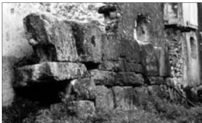
Fig. 1: Fondi: tratto di mura lungo via degli Ausoni